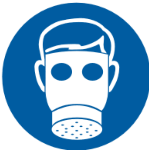
Protectia obligatorie a cailor respiratorii