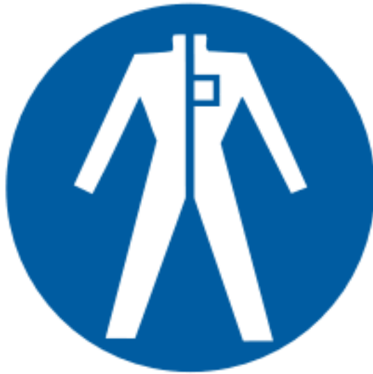
Protectia obligatorie a corpului