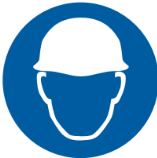
Protectia obligatorie a capului