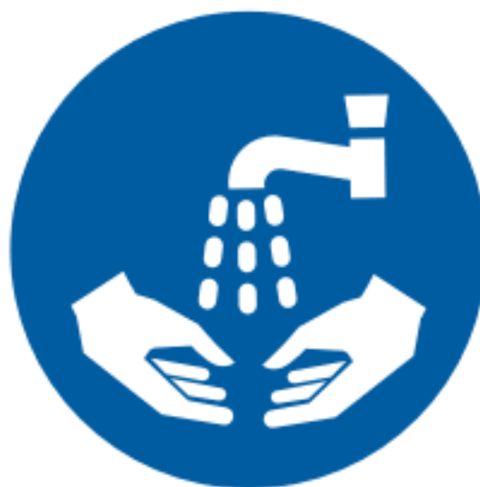
Spalarea mainilor este obligatorie