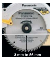
Adâncimea de tăiere reglabil