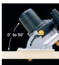
Unghi de tăiere reglabil